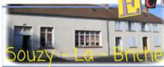
Souzy - La - Briche