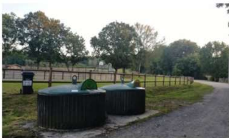
Photo prise le 22 septembre 2021 après intervention des agents municipaux

Après plusieurs courriers/ relances et en l'absence de retour de sa part il a été acté (comme indiqué dans la délibération et les différents courriers) que la commune allait elle-même régler le problème. Merci aux agents techniques qui ont permis d'enlever les bornes et ainsi de répondre à la volonté de faire de notre commune un endroit agréable à vivre.