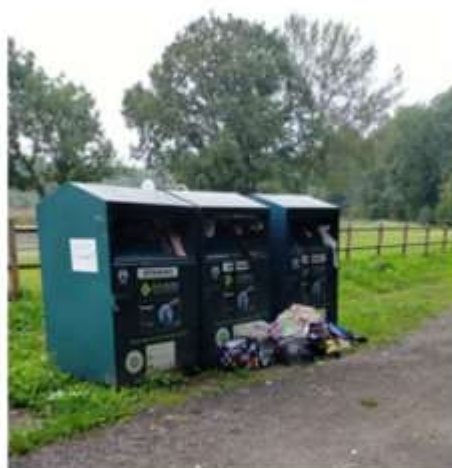
Photo prise début septembre 2021 après une énième relance auprès du prestataire

Tel est le leitmotiv dès lors qu'il s'agit, entre autres, de préserver notre cadre de vie privilégié. Depuis plusieurs mois nous constatons des dérives dans l'utilisation des bornes permettant de recycler les vêtements et toutes les semaines les techniciens municipaux se devaient de suppléer le prestataire en charge du ramassage qui manquait à ses obligations. La Municipalité a donc délibéré en juillet dernier afin de prendre des mesures pour endiguer le problème avec des courriers qui s'en sont suivis auprès du prestataire pour qu'il assure le ramassage des bornes.