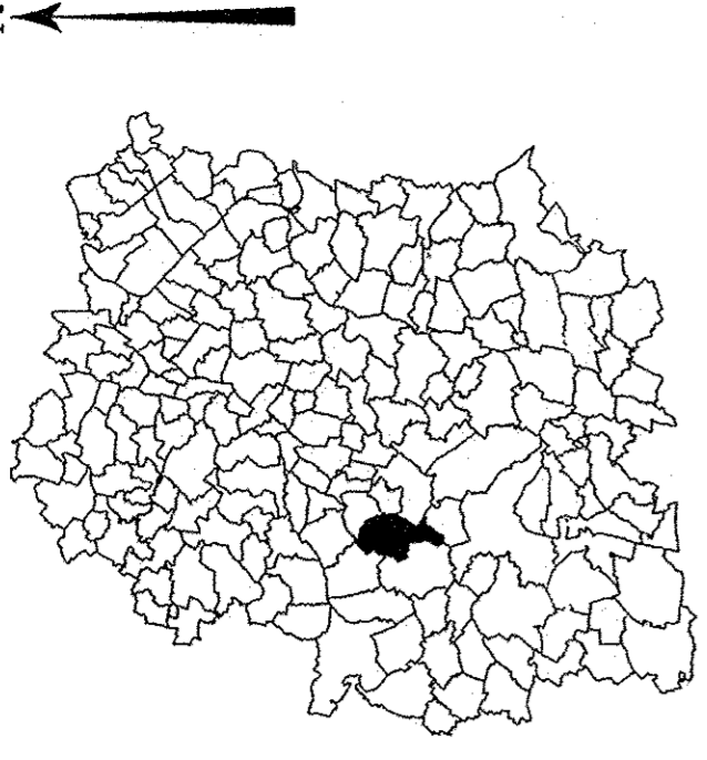
Tableau d'assemblage des communes de l'Essonne