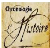
Table chronologique du V au XXI siècle

L'église fut placée sous le vocable de Saint Aubin et de Saint Thibault. Peu à peu, les seigneurs successifs l'embellirent, l'agrandirent. ( lire suite sur le site )