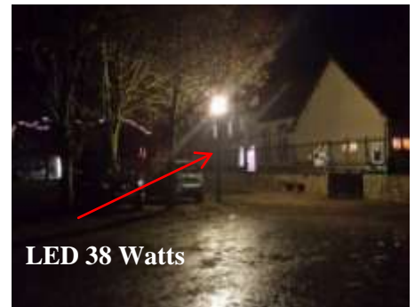
LED 38 Watts

Vous pouvez, en ce moment, observer le rendu de ce type d'éclairage à LED, en démonstration sur le parking de l'église, face à l'entrée de l'école, ainsi que sur la grande rue, face au monument aux morts.